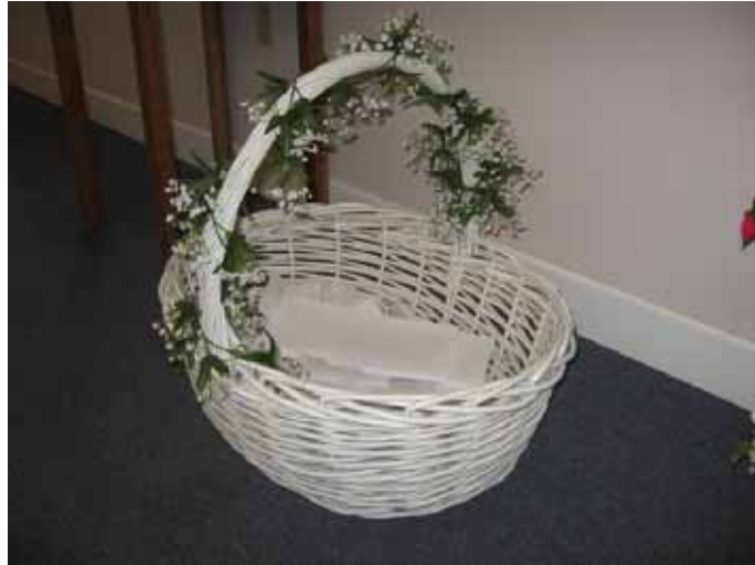
Korb beim Blessing Point, in den die Anliegen hineingelegt werden.